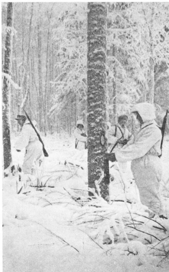
Saavutettu tavoite on turvattava

Olin yksin liikkumaan kykenemättömän miehen kanssa tietämässä metsässä, ehkä vihollisen ympäröimänä. Hänellä oli luodinhaava reidessään, ja hätäntymisestä johtuen hän oli melkein tolkuton. Autoin hänet suksieni päälle vatsalleen, annoin sauvojen päät hänen käsiinsä ja sauvojen toisesta päästä vetäen lähdin raahaamaan häntä pitkin latuja kahlaten metrinvahvuudessa hangessa. Kulku oli mahdollisimman hankalaa. Miehen vatsa laahasi suksien välissä lunta, sukset pyrkivät hajalle toisistaan, ja painavan taakan vetäminen moisessa lu-