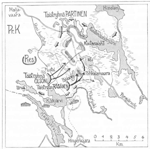
Piirros 2. Kuutamalahden valtaus 27. 8. 41

Kuutamalahden ympäristössä olevat noin 10 km levyiset venäläisten kenttälinoitetut asemat nojautuivat kylän länsipuolella Pahkalanvaarasta lähtien pohjoiseen päin kulkevaan korkeaan, soiden reunustamaan harjanteeseen sekä kyläalueen pohjoispuolella olevaan useiden kookkaiden lampien muodostamaan, Kuutamalahdenjärveen päätyvään vesistölin-