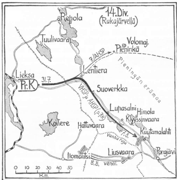
Piirros 1. Prikaati K:n eteneminen Kuutamalahdelle