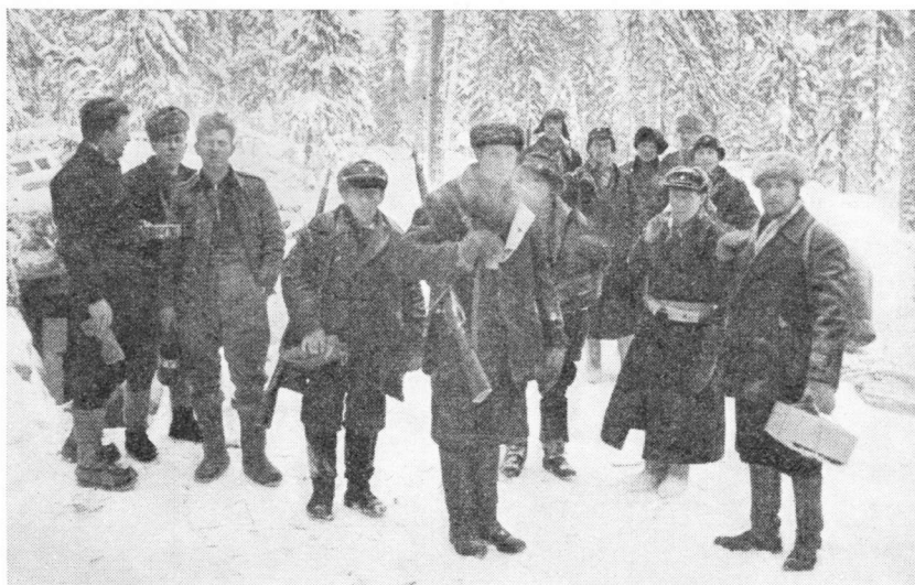
Karjalaisia täydennysmiehiä Kollaalla

taskuun 20 lyijymurikkaa, joiksi berdaanin panosta hyvällä syyllä voi sanoa. Ajan mittaan saatiin nuokin puutteet poistetuksi ja miehille voitiin ojentaa edes kivääri käteen.