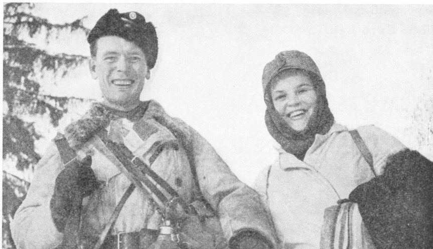
Suomalainen kersantti ja suomalainen lotta talvisodan päiviltä

näissä olosuhteissa omiin erehtymättömiin käsiinsä kansamme johdatuksen sen tulevaisuuden vaatimille oikeille raiteille. Nostattamalla vähitellen kaiken kansan nähtäväksi silloista valtiollista taivastamme varjostamaan ruvenneet ukkospilvet, sai se kansamme vihdoinkin huomaamaan sitä uhkaavan vaaran todellisen suuruuden. Jalommat mietteet kuin kaiken aatteellisen kilvan takaa pilkistävä ja epäjumalana palvottu materialismi, itsekkyys ja vallanhimo, löysivät vihdoinkin niille kuuluvan oikean sijansa kansamme ajatusten piirissä.