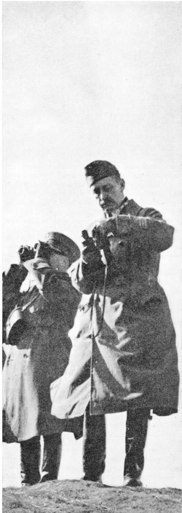
Suomen Marsalkka Mannerheim tarkastamassa vapautetun Kannaksen asemia syksyllä 1941

Takaisinvallattua aluetta Ylipäällikkö ei pitänyt "meidän alueenamme" niinkauan kun sota ei ollut päättynyt. Hän ei hyväksynyt väestön palautusta tälle alueelle eikä sen jälleenrakentamista. Monia avustustoimia, kuten esim. "Kirkkoja Kannakselle"-keräystä hän piti ennenaikaisena. Väestön siirtoa Kannakselle ja Viipurin jälleenrakentamista hän nimenomaan vastusti. Vallattua aluetta, Itä-Karjalaa, hän piti vieraana maaperänä, jonka kohtalo ratkeaisi vasta sodan päätyttyä. Hän oli kuitenkin kiinnostunut siitä ja sen hallinnosta seuraten sitä kiinteästi. Hän vaati, että vallatun alueen väestöä oli ehdottomasti kohdeltava ystävällisesti kansallisuuteen katsomatta. Sitä ei saanut jättää oman onnensa