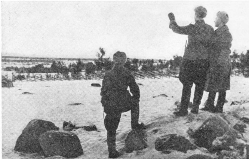
Rajan pinnassa on vielä rauhallista