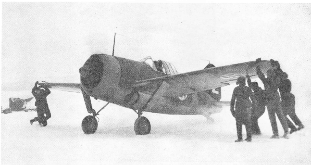
Suomalainen hävittäjäkone talvisodan päiviltä